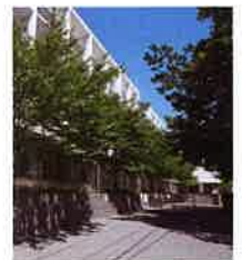
船堀小学校(徒歩4分 約300m)

船堀小学校は、子どもたちが多様な居場所を見出せるユニークな空間設計が特長。光と風が隅々まで行きわたる学び舎が、子どもたちの健やかな成長を支えます。