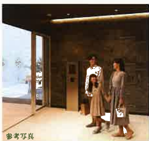
グランドエントランス