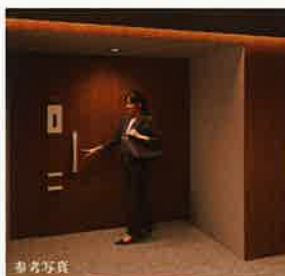
※利用可能身長(約120cm~約190cm)