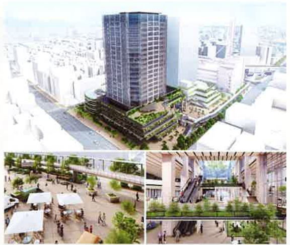
江戸川区役所新庁舎完成イメージ ㊦1

2030年度を目標とする江戸川区役所の移転に伴い、タワーホール船堀の北側で新庁舎をはじめとする複合街区の開発が進行中。快適な都心アクセスと生活利便、さらには進化する街の将来性を享受できる魅力的な駅近立地です。