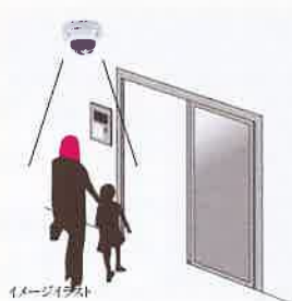
サイクルエントランス