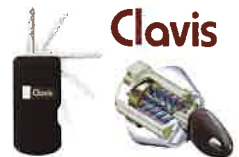
参考写真 参考イラスト

防犯性の高い高性能シリンダー錠 耐ピッキング性能に優れ、鍵の複製も困難な防犯性の高い高性能シリンダー錠を採用しています。