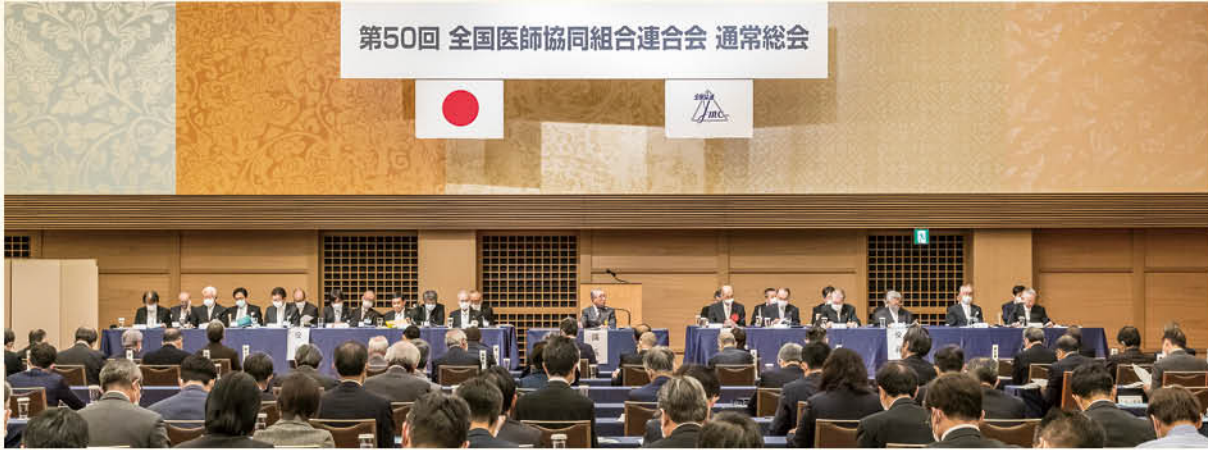
第50回 全国医師協同組合連合会 通常総会