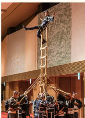
江戸消防記念会による木遣り、梯子乗り

祝賀会では、はじめに東京オリンピックピック2020の開会式にて披露された江戸消防記念会による江戸木遣り、梯子乗りが披露されたあと、鏡開き、日本医師会の渡辺弘司常務理事による乾杯で祝賀会がスタートしました。ピアノ・ドラム・エレキベースによるジャズ演奏が流れる中、全国から集まった医師協同組合の関係者や取引先業者など3年ぶりの宴席となったこともあり、終始和やかな祝宴となりました。