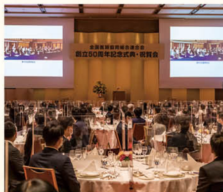
記念式典・祝賀会