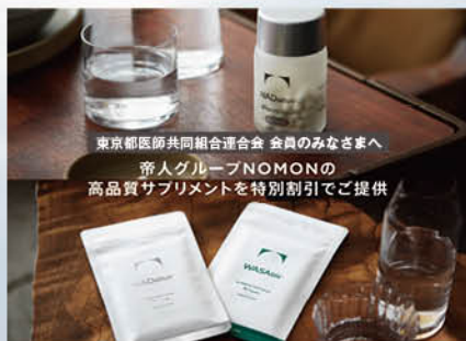
東京都医師共同組合連合会 会員のみなさまへ 帝人グループNOMONの 高品質サプリメントを特別割引でご提供