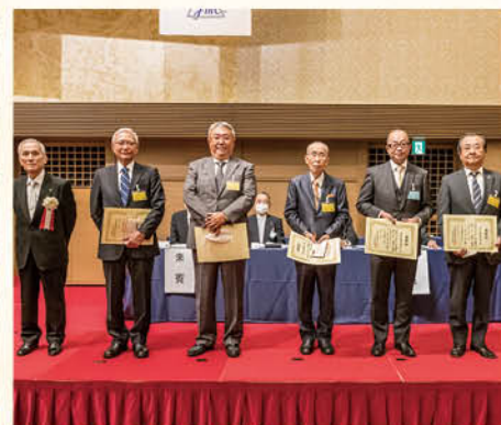
購買部表彰(左から3番目 東京中央医協 黒瀬副理事長)