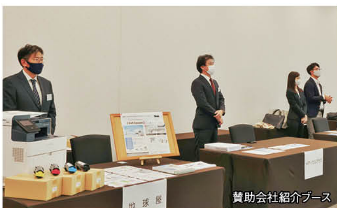
賛助会社紹介ブース

りました懇親会は開催できませんでしたが、賛助会社の皆様のご協力もあって、なんとか盛会のうちを終了することができました。来年以降につきましても、講演会は所属員の先生方の関心の高いテーマを取り上げ、また今年開催が叶わなかった懇親会を開催し、都医協連、地区医協の発展に少しでも結び付けたいと考えております。 今回参加されなかった所属員の方々も、来年は是非ご参加いただければと願っております。