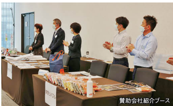
賛助会社紹介ブース